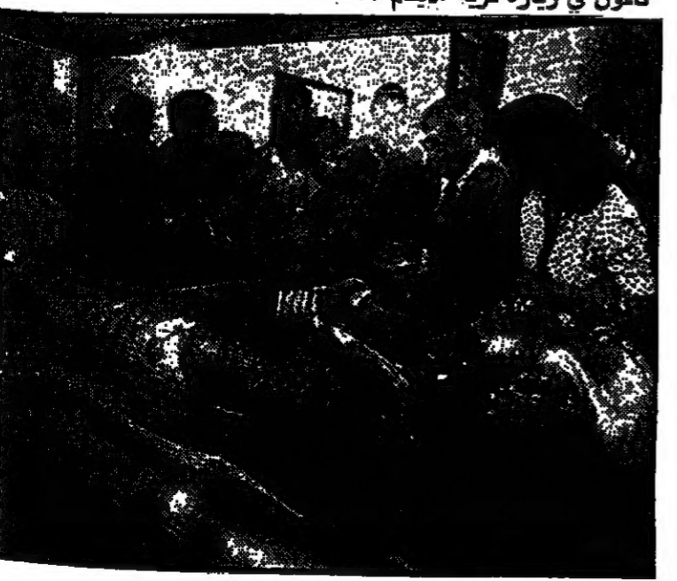
الرئيس ناسون في متحف القاهرة